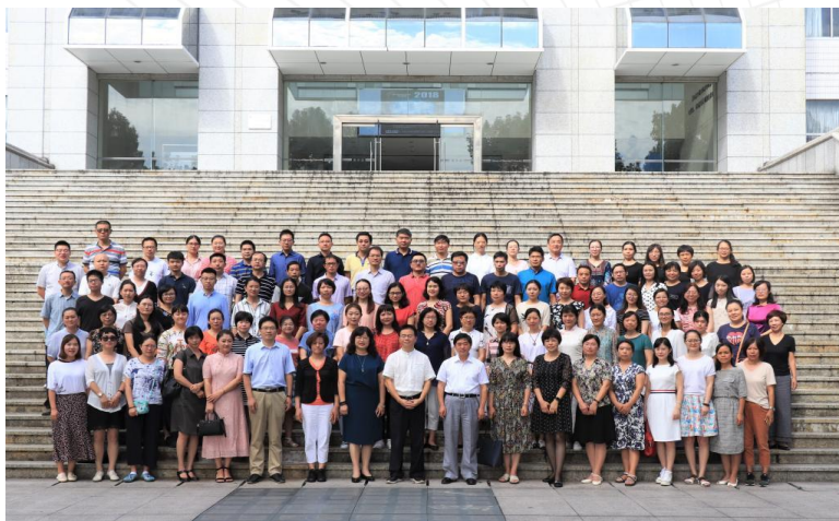
我校图书馆承办高校图书馆知识服务创新研讨暨2018年CASHL服务培训

项目研究成果“基于CASHL资源和服务的知识能力在线评估系统”也得以迅速推广，分别在2016年后的数年内，分别在云南、两广、浙江、山东、北京等地的CASHL全国或区域性的培训工作中多次得以应用，并受到了较好评价。